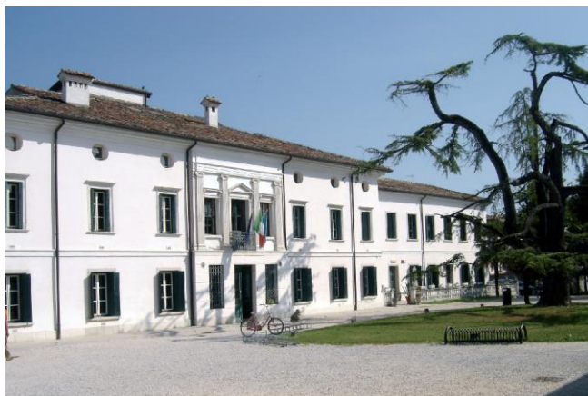
Biblioteca comunale Villa Dora San Giorgio di Nogaro (UD)