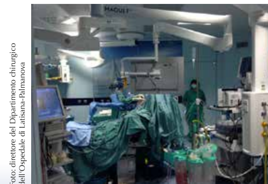
Foto: direttore del Dipartimento chirurgico dell'Ospedale di Latisana-Palmanova