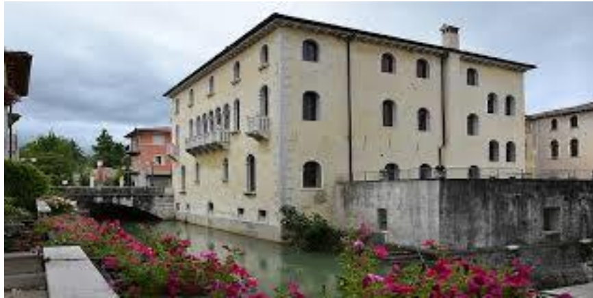
Palazzo Ragazzoni – Sacile