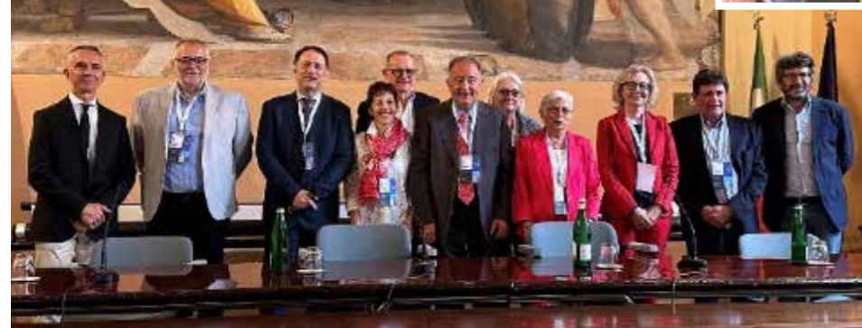
La delegazione di Federsanità ANCI FVG.

16 giugno 2024 - Municipio di Casarsa della Delizia (PN) - 12^ Giornata del Pensionato a cura di CUPLA Pordenone (Coordinamento unitario pensionati Lavoratori Autonomi) con il patrocinio di Federsanità ANCI FVG, CREDIMA s.m.s. e con una folta partecipazione del Gruppo dell'ANAP di Confartigianato Pordenone, ma anche del Gruppo di 50&PIÙ di Confcommercio Pordenone e del Gruppo della Coldiretti di Pordenone.