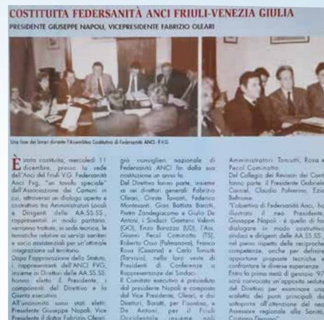
11 dicembre 1996, Udine, sede ANCI FVG, Assemblea costitutiva di Federsanità ANCI FVG.