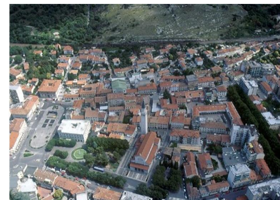
Veduta aerea di Monfalcone