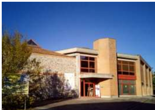
Centro Culturale "Aldo Moro" Cordenons