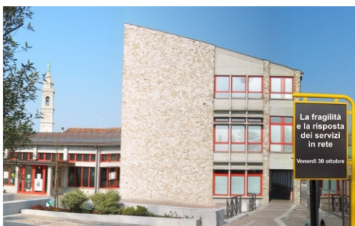
Auditorium Comunale "E. Venier" Via Roma n° 40 - 33037 Pasian di Prato, Ud