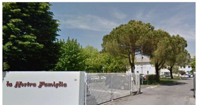
Ass. La Nostra Famiglia - Pasian di Prato, Ud

Una storia che può "Testimoniare" che l'intervento coordinato e multidisciplinare permette di sperimentare l'efficacia del "bene fatto bene" a tutti, in particolare a chi è più fragile.