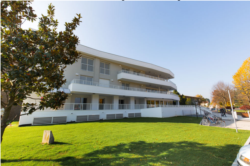
Foto dall'esterno con la visuale del giardino e dell'ingresso della struttura