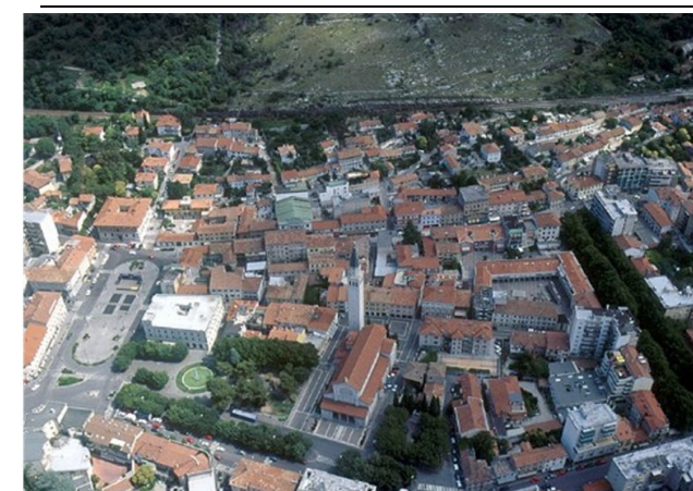
Veduta aerea di Monfalcone